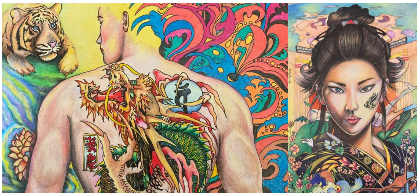
Páva Sándor alkotása