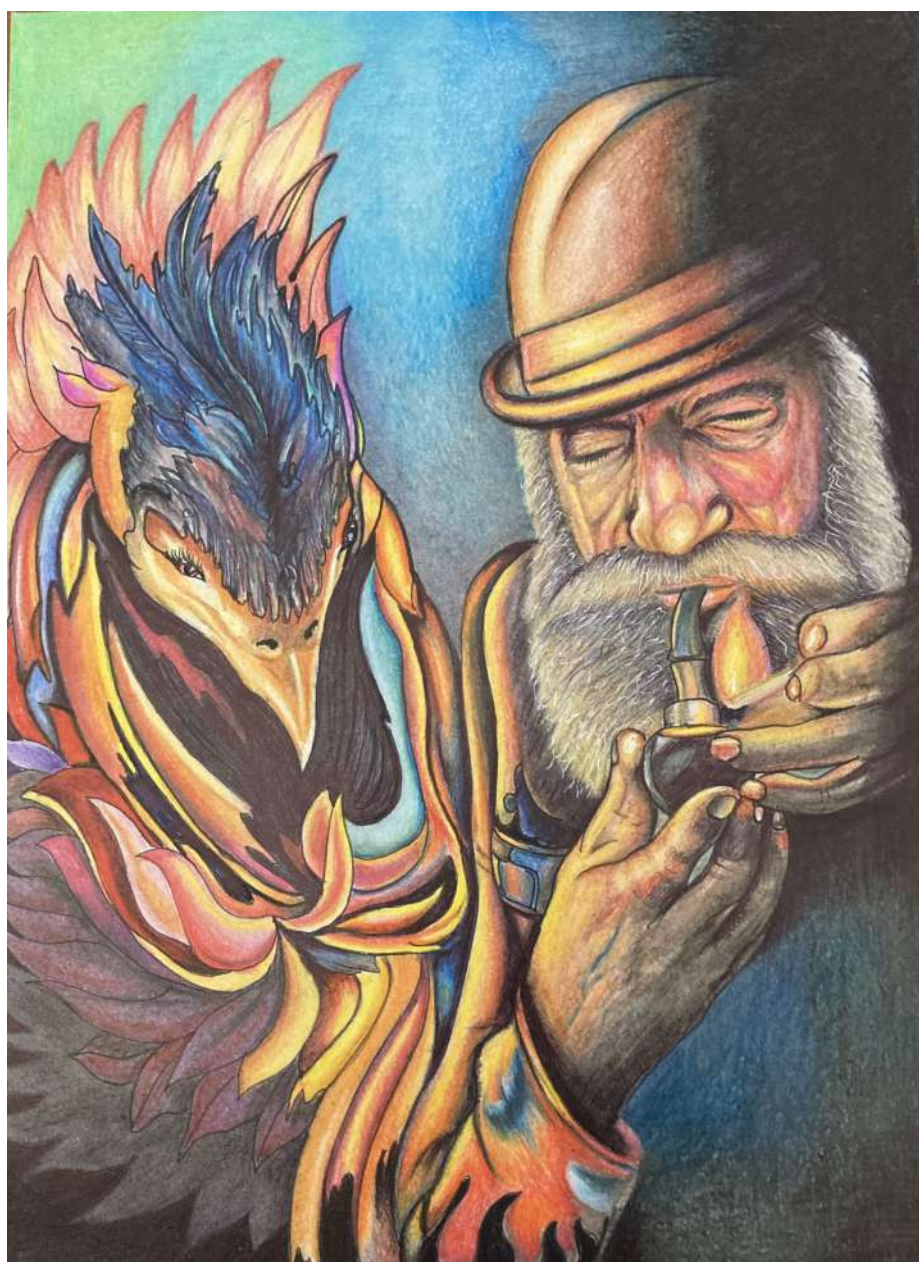
Páva Sándor festménye