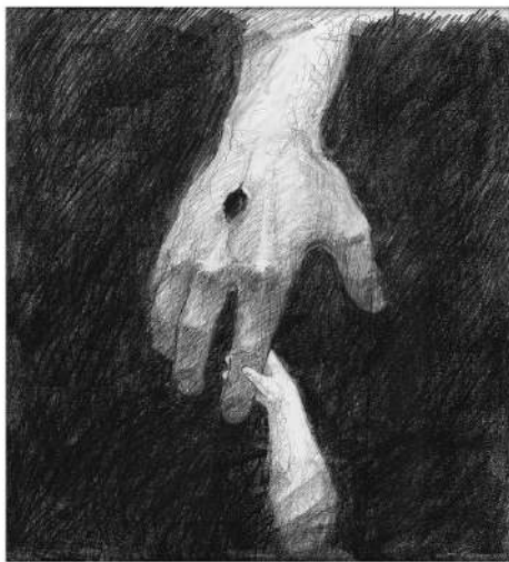
(Jay Risner rajza)

Jézus a feltámadásával bizonyította, hogy igaz volt a tanítása, és az életszemléletének valósága. Életében sem ringatta hiú ábrándokba az embereket, a valóságot mutatta be, de úgy, hogy vágyat keltett a jobbra, az álmoszerűbb valóságra. „Vágyat az fakaszt, ami van, az ábránd pedig a nem létező” (Paul Claudel). Jézus mondanivalója az életről az én felfogásom szerint így hangzik: A földi élet nem mindig habostorta, nincs mindig hab rajta, és néha kesernyés is az íze, mégis torta. Azaz az élet alapjában jó, egy komédia, amiben kikerülhetetlenül is vannak tragikumok. Az élet nem könnyű, ám a kudarcok csak állomások az életben. Ha van hit, akkor életerőd is van felállni, folytatni, változtatni és feltámadni. Ne félj! Bízál bennem, és a rosszban is fogsz tudni találni valami jót, ami előre is tud vinni és tanulhatsz is belőle. Ha megtanulsz elégedettnek lenni, ak-